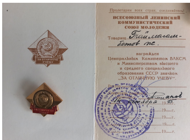
Удостоверение к студенческой награде ВЛКСМ За отличную учебу.