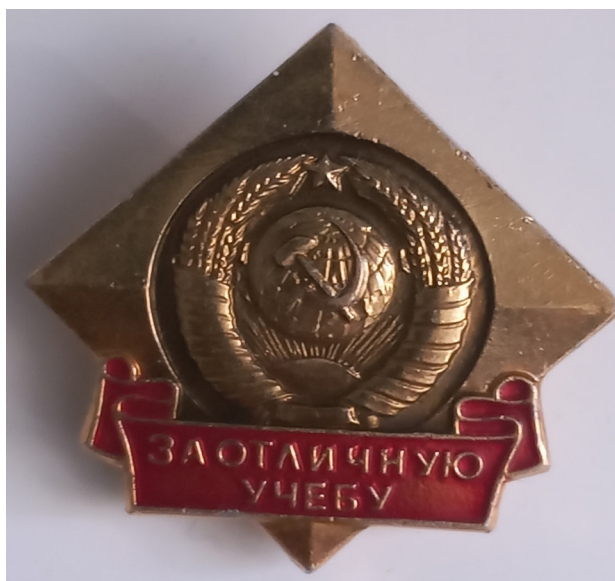
Значок За отличную учебу.